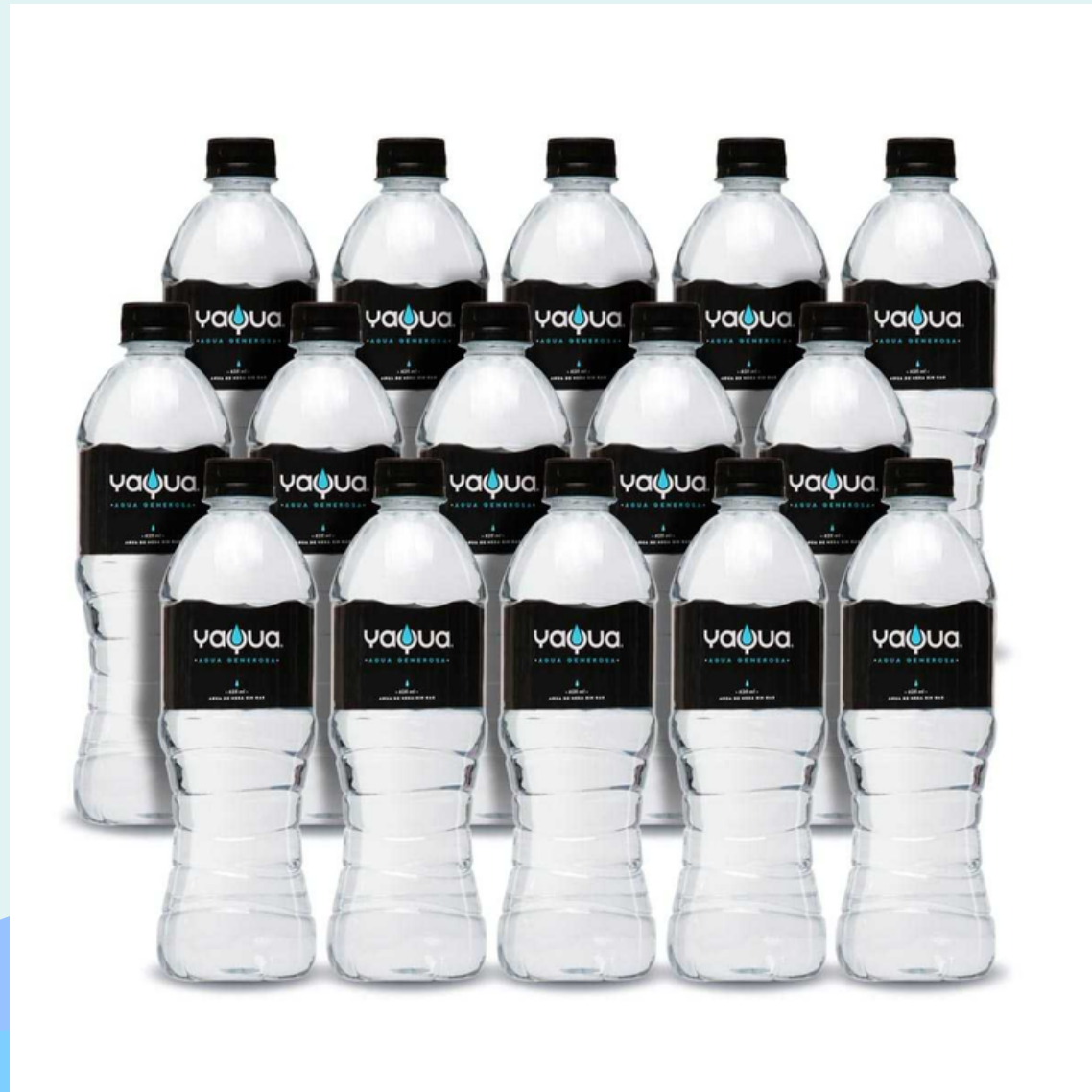
AGUA YAQUA 625ML